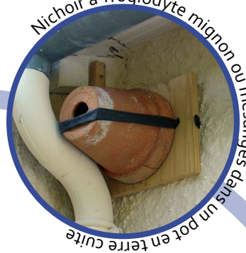
Nichoir à Troglodyte mignon ou mésanges dans un pot en terre cuite

Si vous ne pouvez pas conserver des sites de reproduction, vous pouvez compenser en posant des nichoirs adaptés.